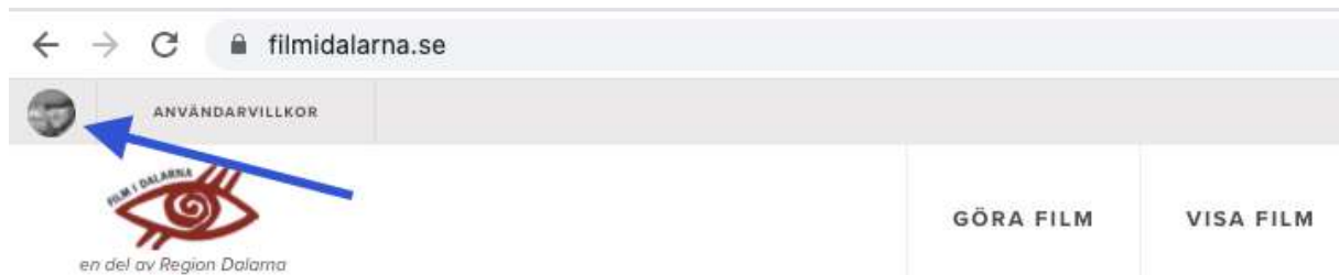
Figur 2. Startsidan filmidalarna.se - inloggad

Är du inte inloggad syns knappen "logga in" som bilden ovan (figur 1) visar.