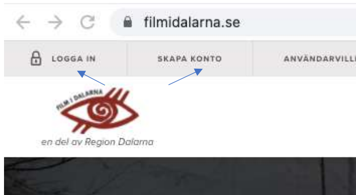
Figur 1. Startside filmidalarna.se – i läget "ej inloggad"

Om du inte redan har en profil måste du skapa en ny. Du får ett verifikationsmejl du måste svara på i denna process, titta även i din skräppost om du inte ser något mejl efter ett par minuter.